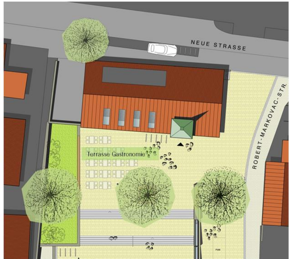
Ausschnitt Rathaus / Gastronomie