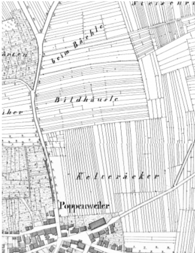
Ausschnitte Flurkarten NO 3914 und NO 3814

Das Gebiet nördlich der ehemaligen Kelter hatte schon in Zeiten der Landesvermessung in den 1830er Jahren den Gewannname Kelterracker.