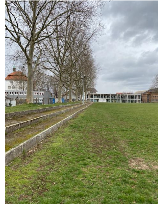
Planung Lage Außenbereich