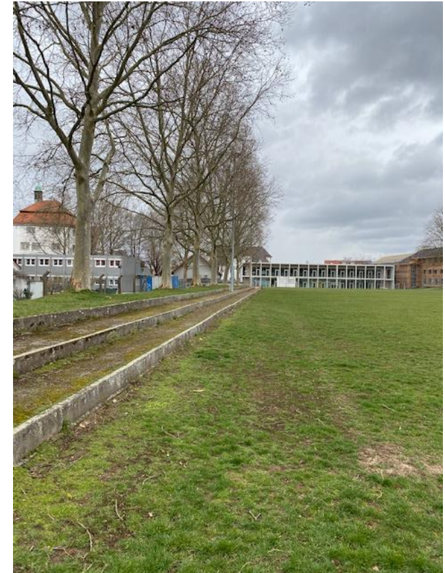
Planung Lage Außenbereich