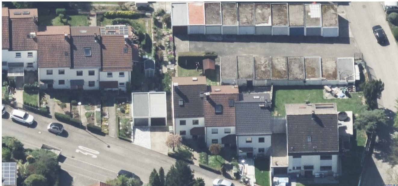
Fallbeispiel: Vorgartenbereiche Am Ring (Poppenweiler)