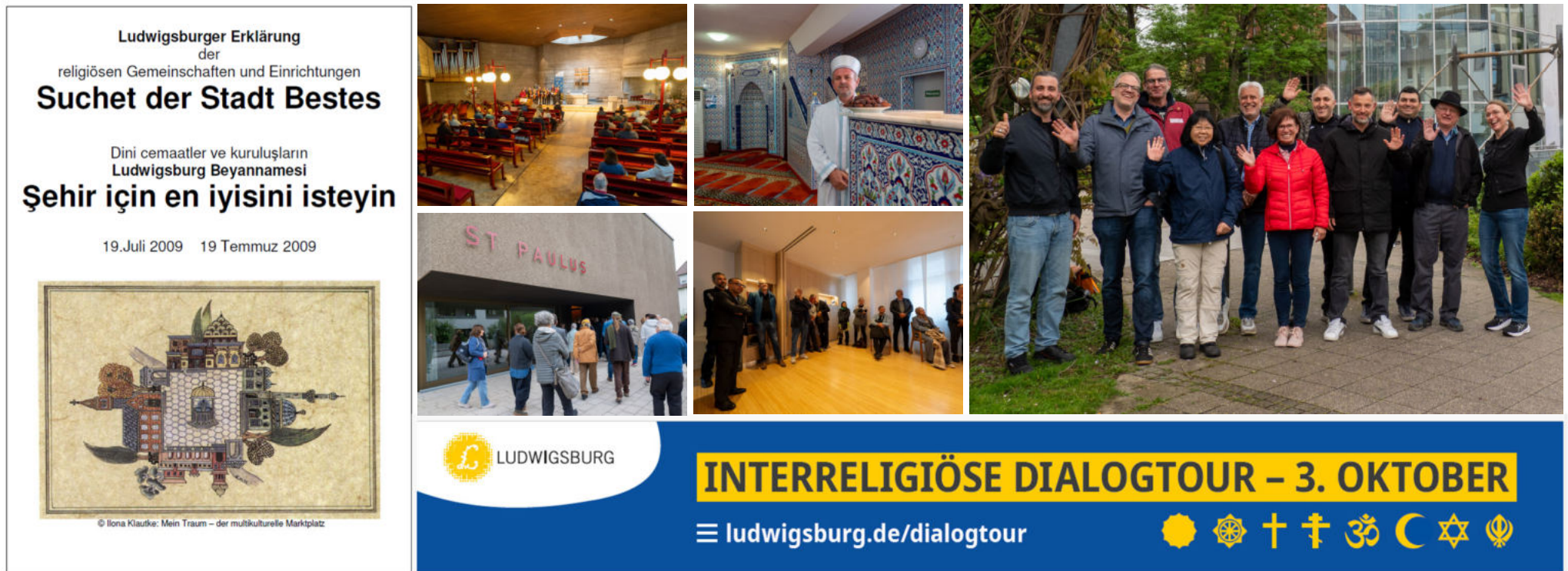
Von links nach rechts: Deckblatt der Ludwigsburger Erklärung, Bilder der Dialogtour 2024, Besprechung zum Garten der Religionen auf dem Solitudeplatz